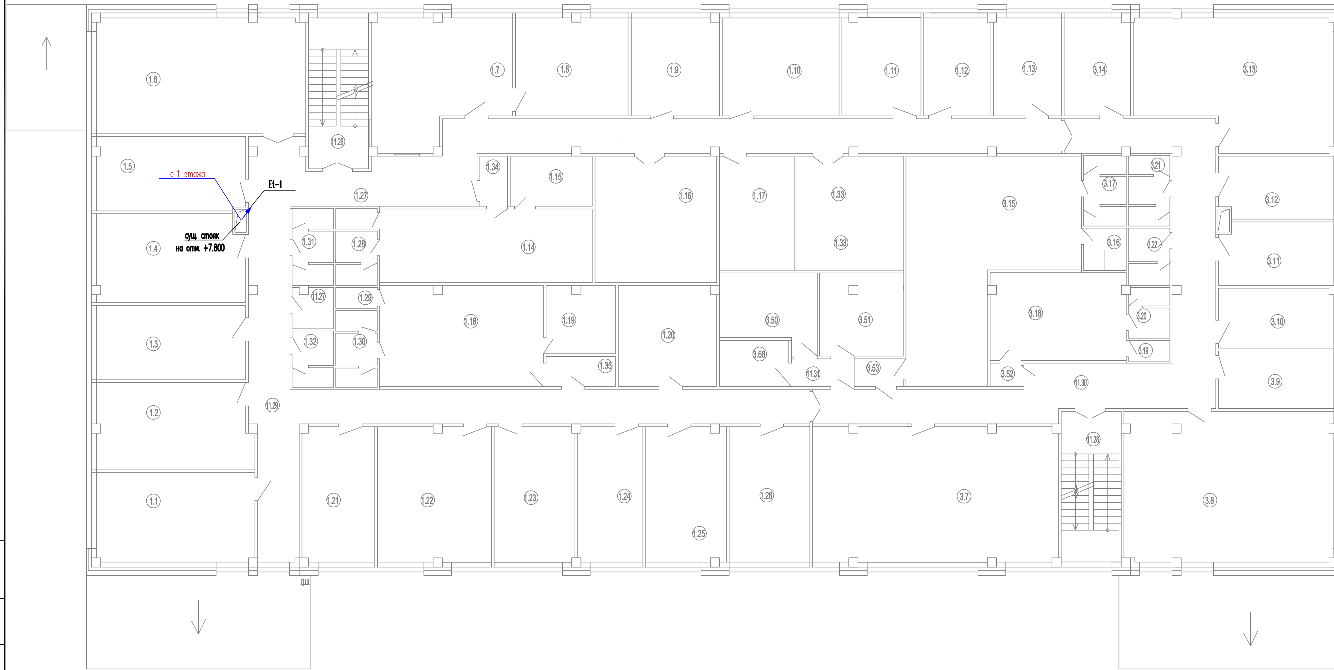
План 2-го этажа М 1:100